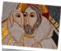
Il buon pastore