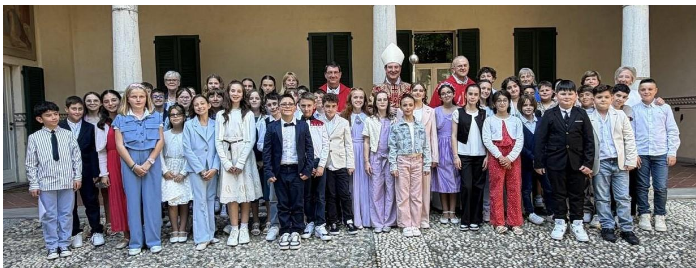
Sabato 23 maggio: Santa Cresima dei nostri ragazzi di V elementare

Martedì 9 giugno inizia l'oratorio estivo. Durerà quattro settimane fino a venerdì 3 luglio . Lo slogan è "Bella Fra! Guardate a Lui e sarete raggianti" e fa riferimento alla vita e alla spiritualità di san Francesco , a 800 anni dalla sua morte. Giochi, attività, uscite sul territorio e naturalmente la preghiera quotidiana scandiranno le giornate di queste settimane. Ringraziamo fin d'ora gli animatori , gli educatori , tutti gli adulti volontari e il coordinatore dell'oratorio per il tempo che, con generosità, passione ed entusiasmo, metteranno a servizio dei nostri ragazzi per permettere loro di vivere un'estate davvero speciale! Terminata l'esperienza estiva, l'oratorio dal 5 al 12 luglio si trasferirà a Pré Saint Didier , in Valle d'Aosta, per la vacanza comunitaria .