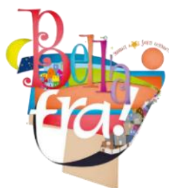
e con i ragazzi dell'oratorio estivo